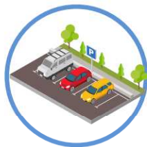
des voiries et parkings