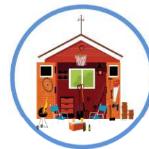
des hangars et locaux de stockage