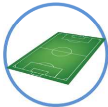
des aires de jeux et terrains de sport