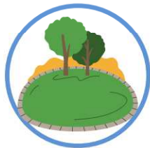
des pelouses et espaces verts publics ou privés