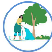
des potagers, vergers et arbres de moins d'un an de plantation