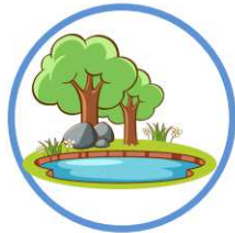
des étangs et plans d'eau