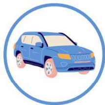
des véhicules hors installations professionnelles