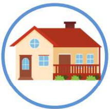
des terrasses, cours et façades