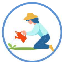
des jardins d'agrément