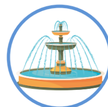
des fontaines d'eau alimentées par le réseau d'eau potable, sans recyclage d'eau